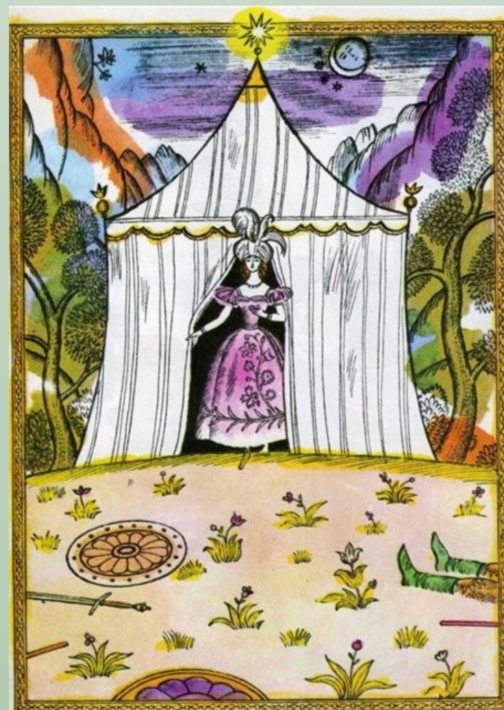
Шалаш шамаханской царицы