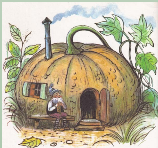
Домик - тыква для гнома