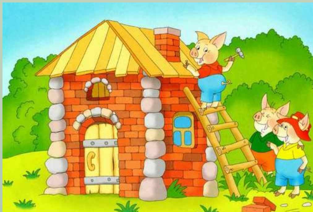
Домики трёх поросят