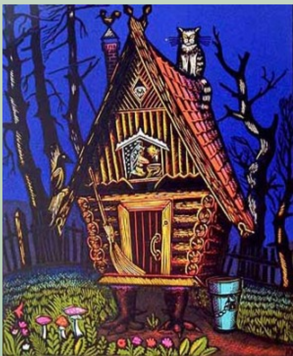
Избушка на курьих ножках